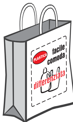
Imballaggi in plastica