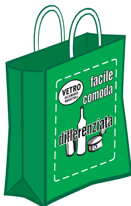
Vetro, alluminio e barattoli