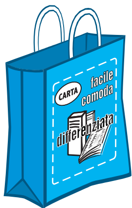
Carta e cartone

Ad ogni famiglia vengono consegnate tre comode borse per separare i rifiuti riciclabili e conferirli agevolmente nei contenitori stradali, una piccola pattumiera sottolavello con una dotazione di sacchetti in mater-bi, per i rifiuti organici, quali gli scarti di cucina.