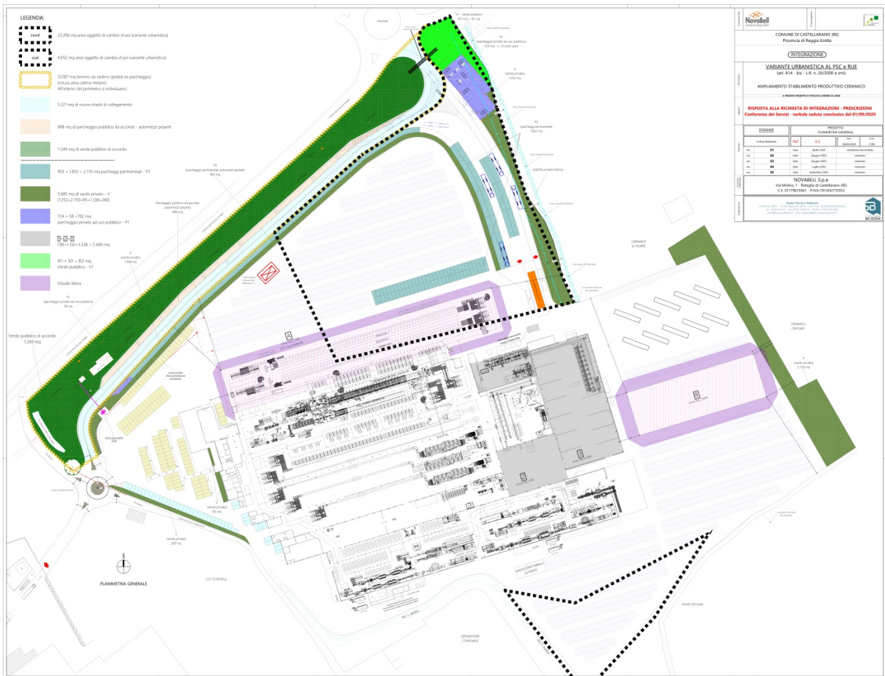
Figura 3 variante urbanistica PSC e RUE, tavola 0.3 rev.05 settembre 2020, inclusiva della fascia a verde al confine est