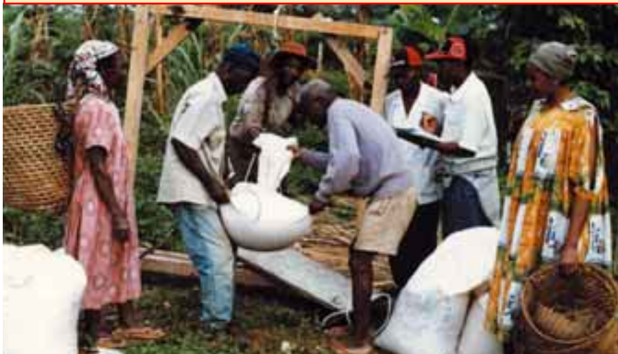
Nella foto in alto una veduta di Cadiroggio; sopra contadini del Camerun al lavoro nelle piantagioni di cacao