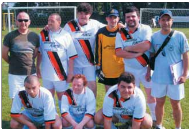
Una recente immagine della formazione dei GS Castelli

Si terrà da martedì 25 a sabato 29 aprile 2006 l'European Football Week organizzato dal Gs dei Castelli, il gruppo sportivo che da anni opera a Castellarano e nei Comuni del distretto occupandosi prevalentemente della promozione e diffusione dello sport tra i "diversamente abili".