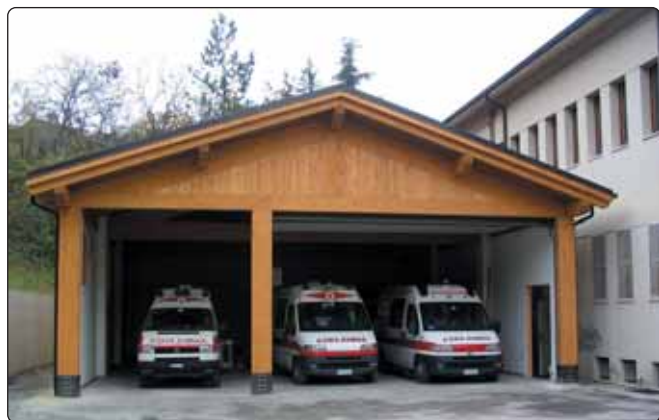
Il deposito/autorimessa della CRI di Castellarano che potrà ospitare 6 automezzi e il materiale della Protezione Civile

Sono terminati i lavori di realizzazione del deposito - autorimessa del Centro Civico in via Roma.