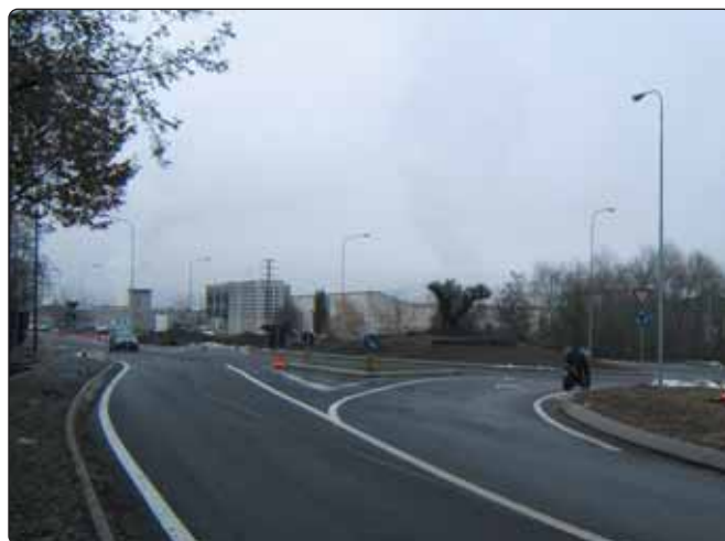
La nuova rotatoria all'ingresso di Roteglia

Sono in fase di ultimazione i lavori per la realizzazione della rotatoria all'ingresso dell'abitato di Roteglia. Si tratta di un intervento particolarmente atteso in un tratto dove,