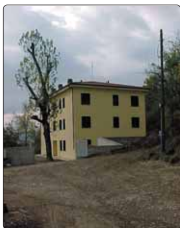
La struttura dove sorgono gli alloggi disponibili in località Caffarello

Il costo complessivo sostenuto è di 632.000 € finanziati per 316.000 € con contributo regionale vincolato all'edilizia sociale e per 316.000 € con risorse comunali.