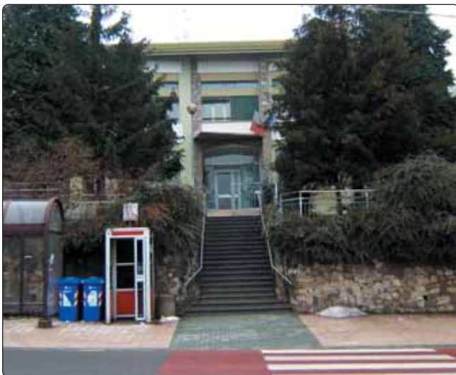
A sinistra, l'attuale sede delle scuole di Tressano e, sotto, l'area dove sorgerà il nuovo complesso scolastico

Si è quindi ritenuto opportuno classificare un lotto di terreno per ottenere la cessione dell'intera area scolastica a costo zero per l'Amministrazione e riqualificare due aree limitrofe trasformandole da industriali a resi-